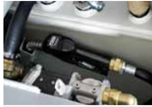
Fyllepistol med 4m fylleslange