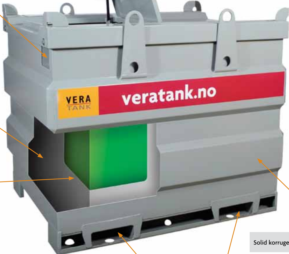
Rom for utstyr