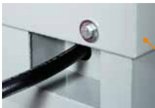
Uttak for sugeslange