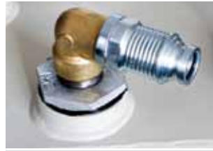
Ekstra uttak m/ T hurtigkobling