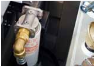
Pumpe med filter